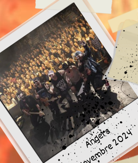
Angers Novembre 2024

"Un groupe qui transmet l'essence même de Scorpions, avec une énergie communicative"