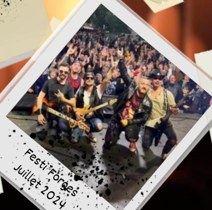
Festi'Forces Juillet 2024

"C'était au top, merci encore d'avoir fait briller les yeux de nos fous! Ils veulent maintenant monter sur scène et faire de la musique. Bonne continuation à vous, vous êtes un excellent Tribute"