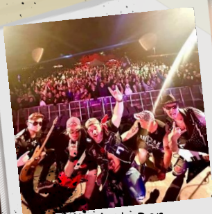
Lac du Der Mai 2025

"Merci à vous pour votre gentillesse, votre professionnalisme, pour les supers personnes que vous êtes! Pour ce super concert, à très bientôt"